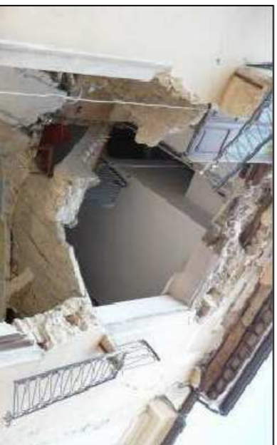
L'Aquila: crollo di una unità edilizia in cui era stato inserito uno scalo e uno soletto in c.a.