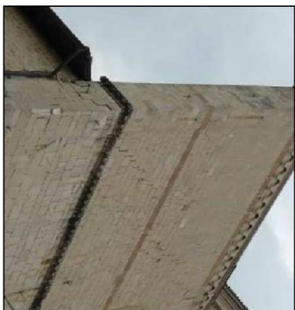
L'Aquila, chiesa di San Silvestro: lesione su un muro sventante