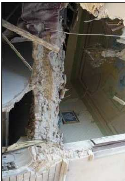
L'Aquila: crollo o moerita. Il mancato innescio del meccanismo di ribaltamento monolitico della porzione muraria è dovuto allo scarso qualità dell'operechico