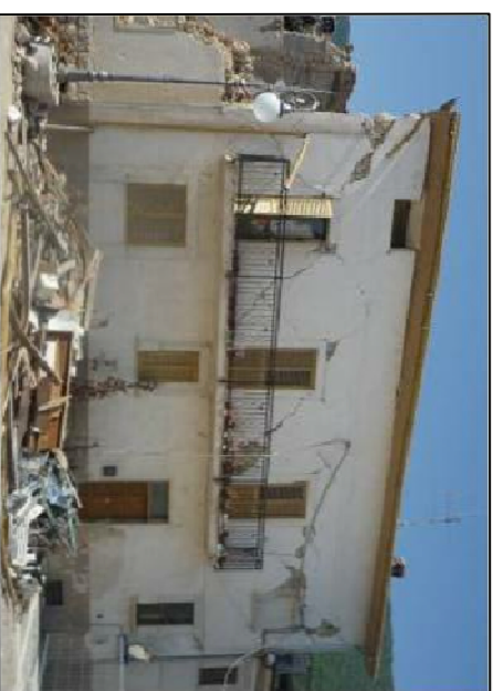
Villa Sorli'Angelo: lesioni a taglio in corrispondenza dei maschi murari