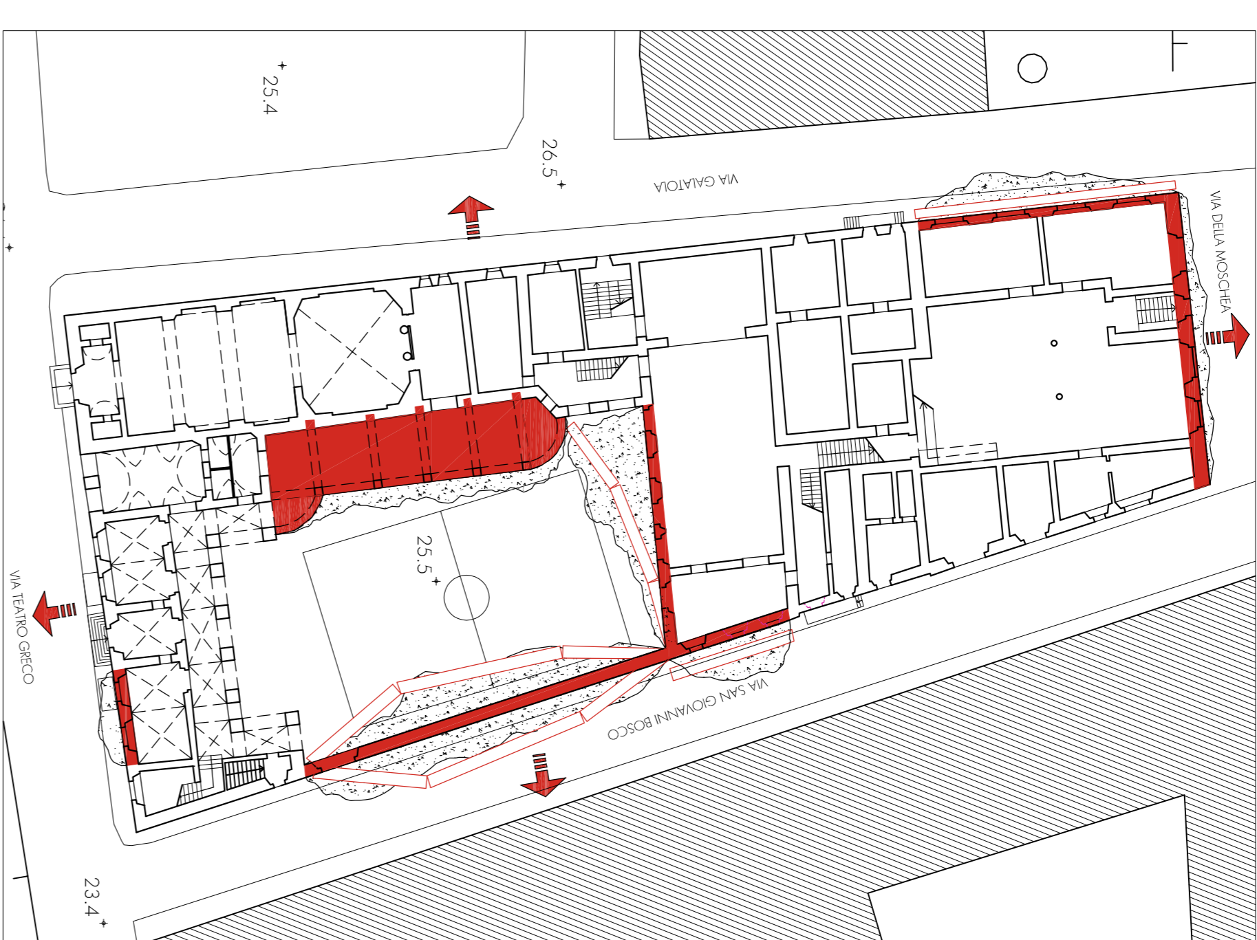
LA LEZIONE DEL TERREMOTO: L'AQUILA 2009