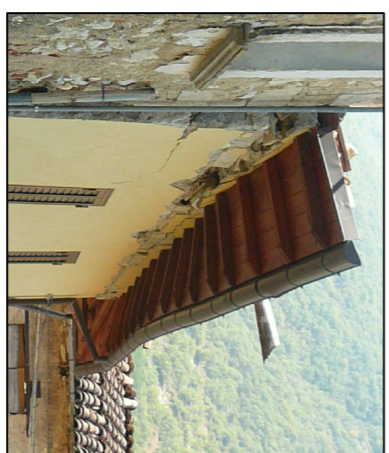
Villa Sorli'Angelo: siltamento del cordolo in cemento armato sulla struttura muraria