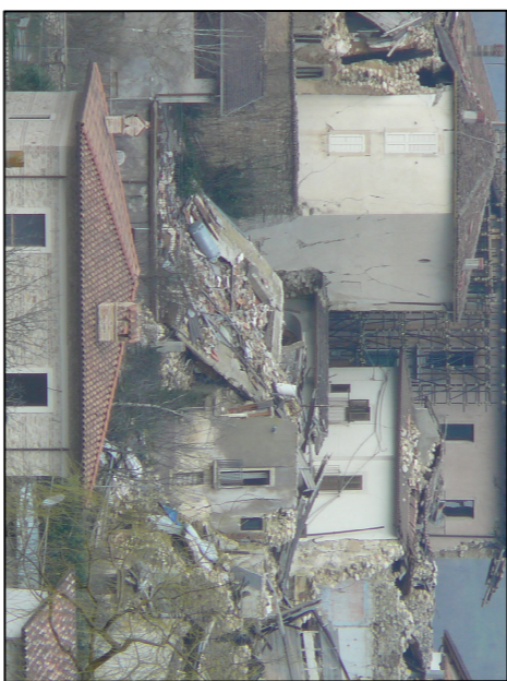
Villa Sorli'Angelo: due diversi esempi di crollo della copertura in c.a.