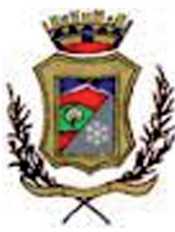
Comune di Nicolosi

I° CONCORSO FOTOGRAFICO E VIDEO info e regolamento su: www.etnaunesco.eu www.antonioparrinello.com