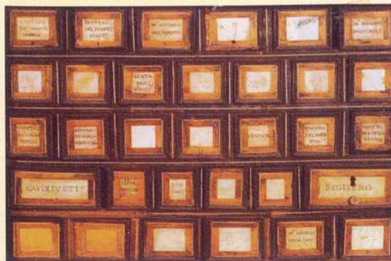
Stampa: SIGNORELLO (CT)

Le donazioni frequentemente conferite all'Archivio Storico da Istituti, Enti e privati cittadini consentono al medesimo di accrescere il suo patrimonio culturale, ponendolo a disposizione di tutti.